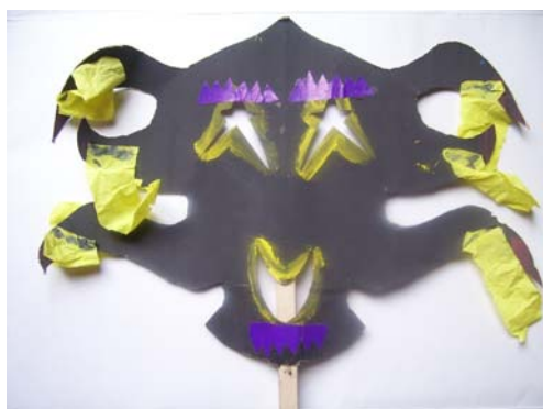
Máscara elaborada en el taller que hicimos